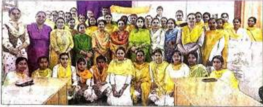
ਮਾਲਸਾ ਕਾਲਜ ਫਾਰ ਵਿਮੈਨ ਸਿੱਧਵਾਂ ਖੁਰਦ ਵਿਖੇ ਸ਼ਹੀਦ-ਏ-ਆਜ਼ਮ ਭਗਤ ਸਿੰਘ ਦੇ ਸ਼ਹੀਦੀ ਦਿਵਸ ਨੂੰ ਸਮਰਪਿਤ ਕਰਵਾਏ ਸਮਾਗਮ ਸਮੇਂ ਵਿਦਿਆਰਥਣਾਂ ਨਾਲ ਕਾਲਜ ਦਾ ਸਟਾਫ਼।