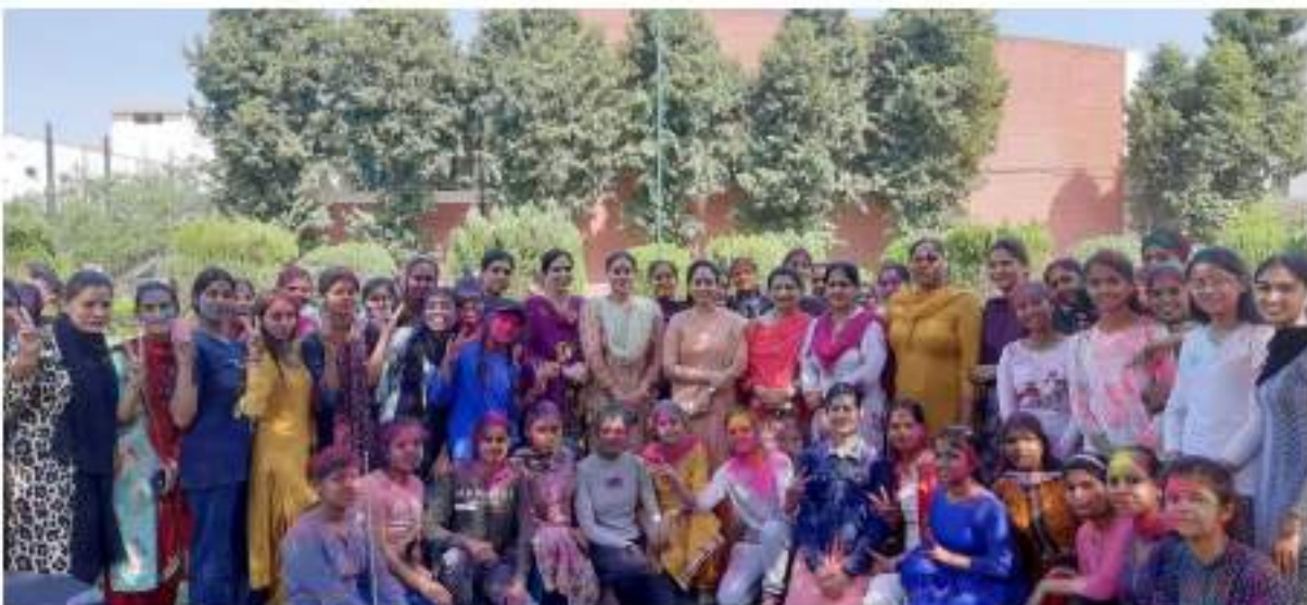
On March 08, 2023, Festival of Holi was celebrated by staff and students with fun and frolic.