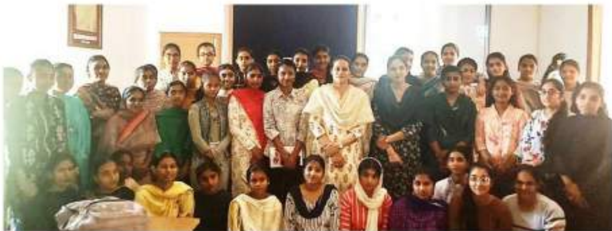
On March 27, 2023, Post Graduate Department of Punjabi screened tele films 'Dharti Hethla Bald' and 'Anne Ghode da Dan' prescribed in the syllabi of BA, BABEd and B.Sc BEd First year and Third year respectively. 'Anne Ghode da Dan' effectively picturized the disparity between the