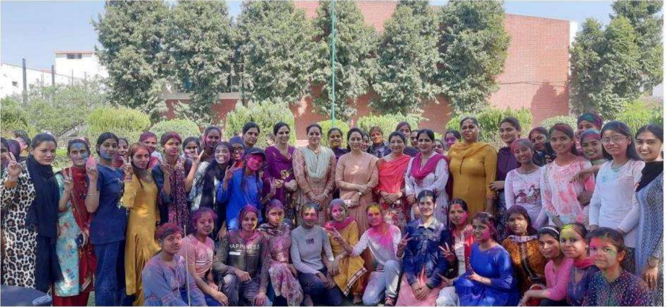
On March 08, 2023, Festival of Holi was celebrated by staff and students with fun and frolic.