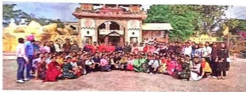
ਵਿਦਿਅਕ ਟੂਰ ਦੌਰਾਨ ਮਾਨਸਾ ਕਾਲਜ ਫਾਰ ਵਿਮੇਨ ਦੇ ਅਧਿਆਪਕ ਅਤੇ ਵਿਦਿਆਰਥਣਾਂ।