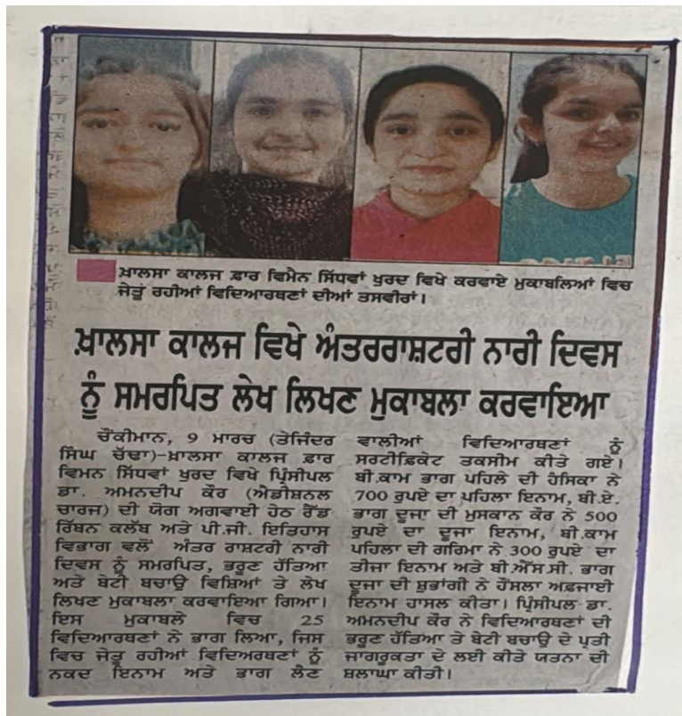
Participation of students in Essay writing competitions on various topics.