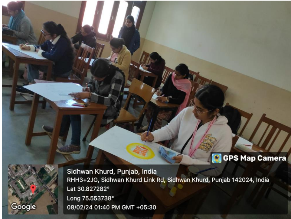
Participation of students in poster making competitions