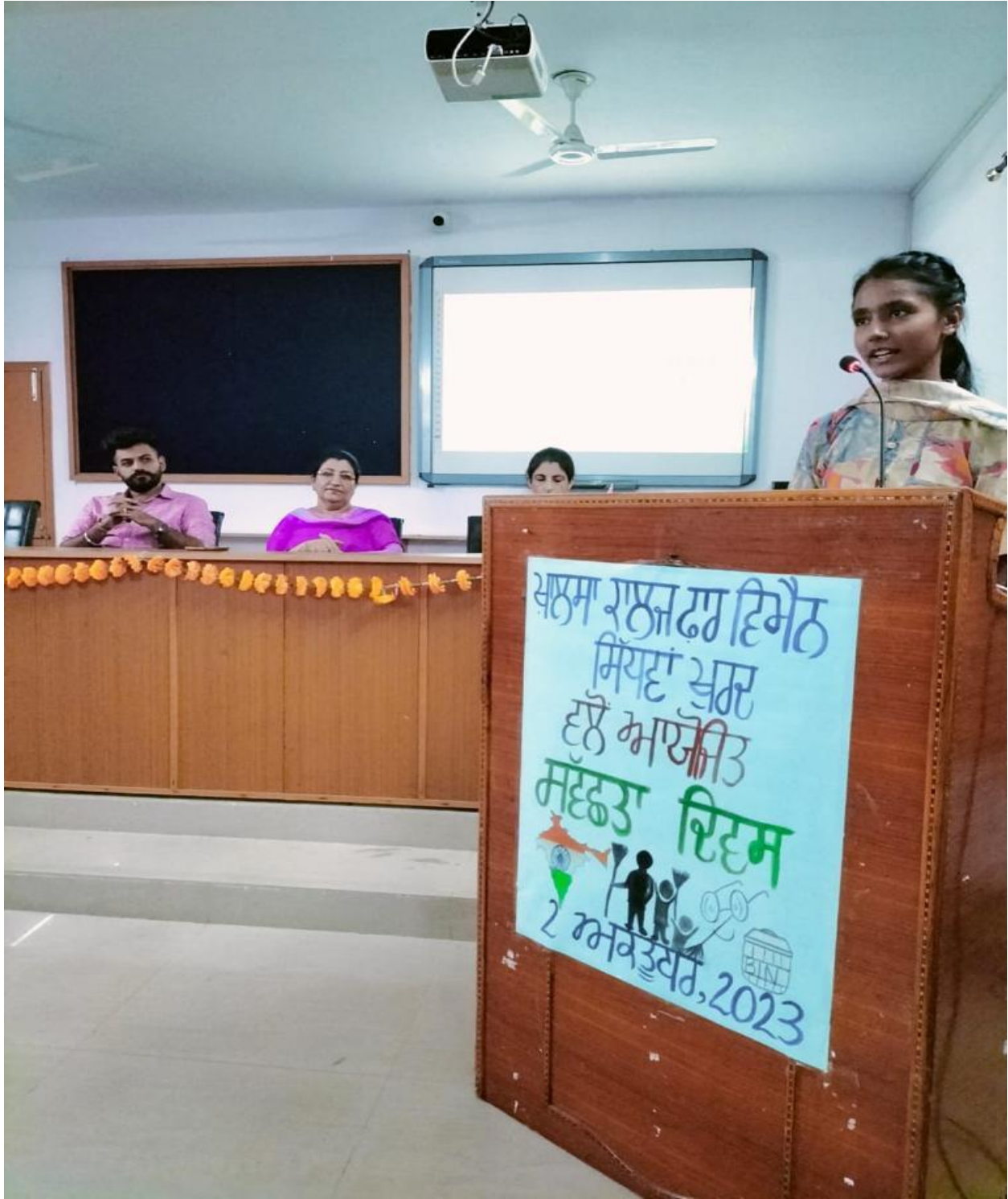
Participation of students in declamation contests held regularly.