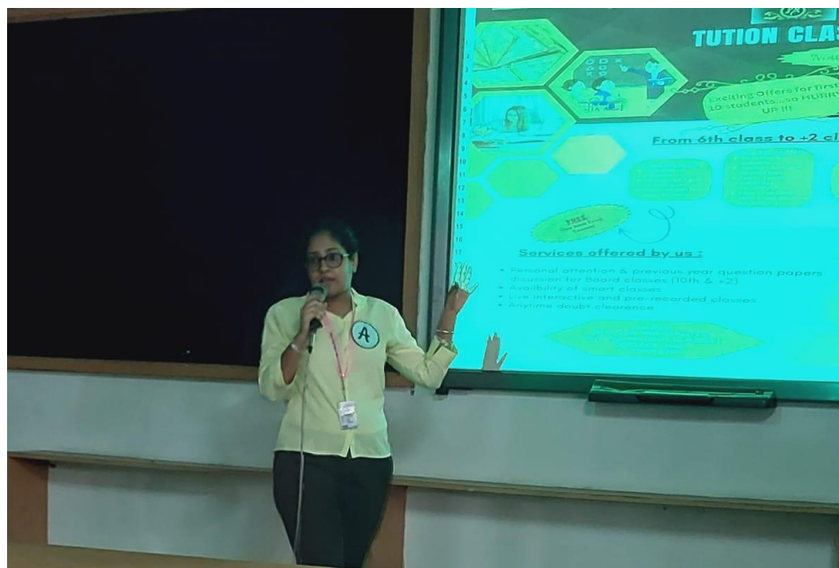
Power Point Presentations and Talks by students