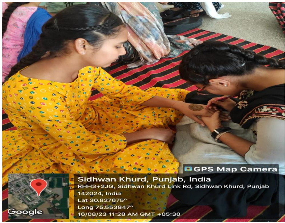
Bussiness fest Earn while you learn celebrated.