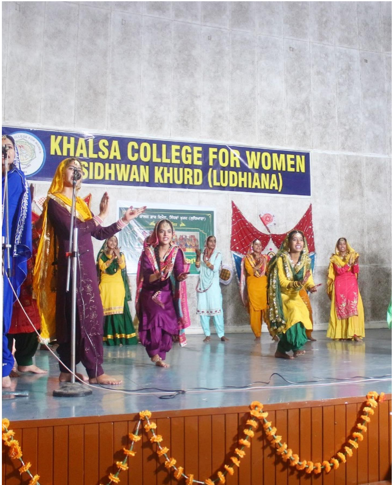
Celebration of Saawan/Teej Festival.